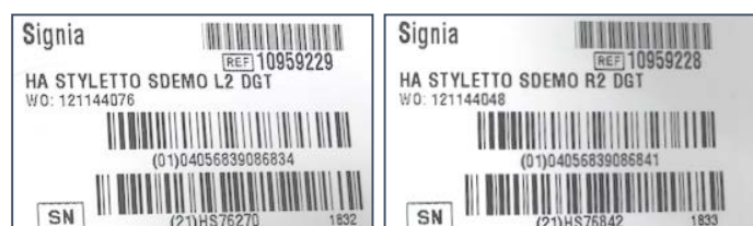
シリアル No シールは2枚